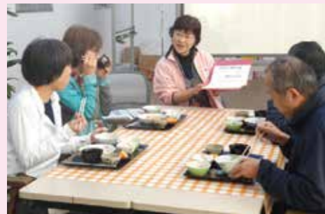
▲11/21 中庭(あらたきドーム)にて。活発な意見交換が行われました。

2日間でご家族8名が、オレンジリング(認知症サポーター養成講座を受講して認知症の方やその家族を支援するために正しい知識を身につけた方に渡される目印です。)を受け取られ、「目から鱗でした。わかりやすかったです!」「認知症についての理解が深まりました。」等感想をいただきました。