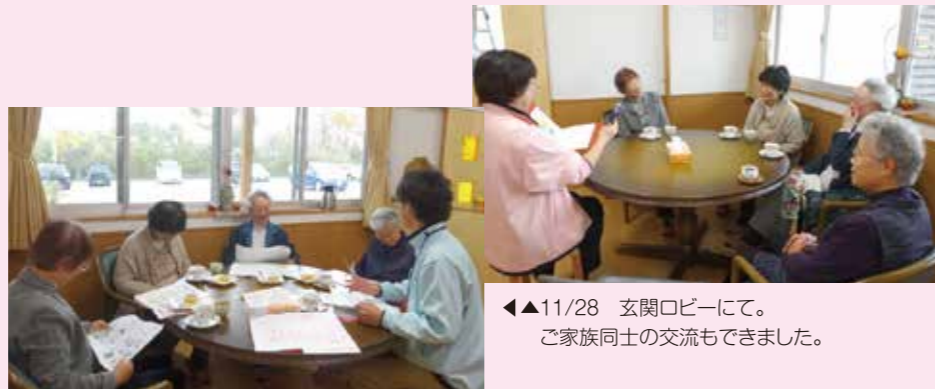
◀11/28 玄関ロビーにて。ご家族同士の交流もできました。

認知症になっても安心して暮らせるまちづくりを目指して、事業所としてできることを今後も続けていきたいと思ひます。