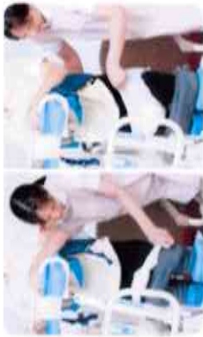
▲ 直立姿勢で下着の上げ下げが可能