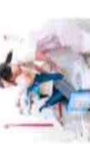
▲ 臀部を覆わないので下着が外れる