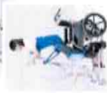
▲ 立ちにくい姿勢までリフトアップ可能