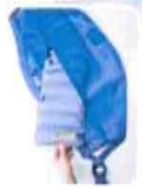
▲ エアクッション内蔵