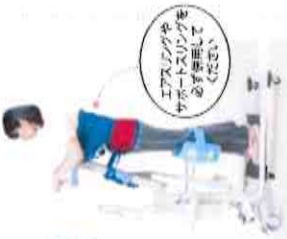
エアスリングやサポートスリングを必ず併用してください。